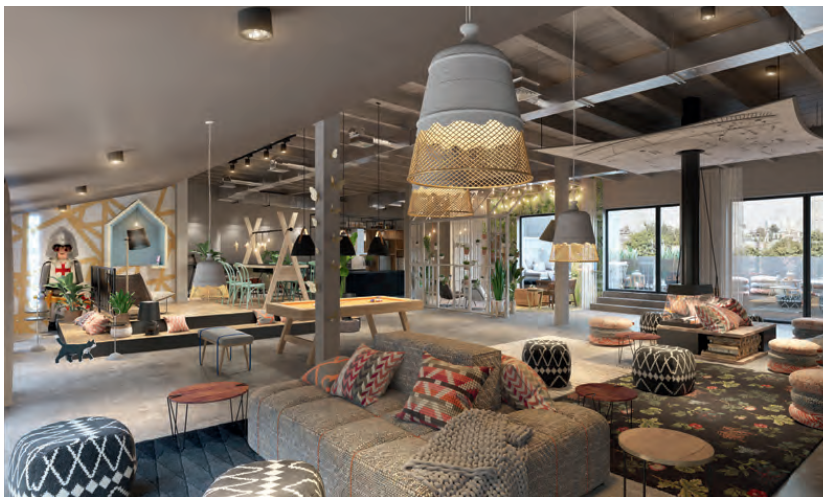
Die Feuerstelle mit angedeutetem Kamin und drumherum gruppierten Poufs ist ein wiederkehrendes Element der „Stay Kooook“-Hotels. Der lebensgroße „Playmobil“-Ritter an der Wand ist eine Reminiszenz an die Burgen- und Spielzeugstadt Nürnberg.

Flexibler Wohnraum auf 22 qm: Mit einem kräftigen Dreh lassen sich Küchenzeile und Schrankfläche dank des beweglichen Wohnmoduls hinzu- oder wegschalten.