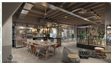
Die Wohnküche mit großem Esstisch ist allen „Stay Kooook“-Hotels gemein.